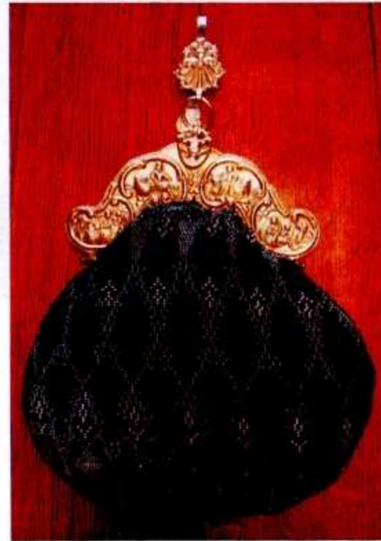
Klaas van Giffen (Overveen)

Met zorg is geprobeerd om de zilveren beugel te voorzien van een bijpassende tas. Die werd destijds uitgevoerd in leer of fluweel, maar na 1750 kwamen ook tassen van geborduurde kralen in gebruik en daar is een replica van gemaakt. Nadat een oud borduurpatroon passend was gemaakt op de vorm van de beugel ontstond er na enige maanden huisvlucht een goed passende combinatie, die hieronder wordt weergegeven: