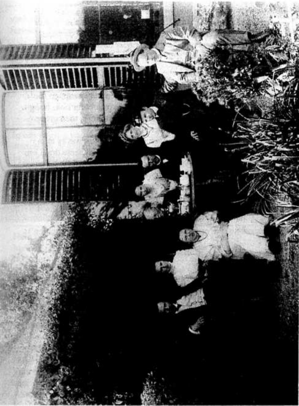
DE FAMILIEDAG KOMT ERAAN, OP d.v. 15 SEPTEMBER 2007 HOPEN WIJ ELKAAR WEER TE ONTMOETEN